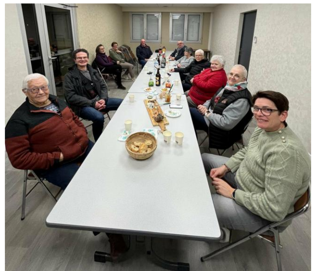
Amicale des Anciens Combattants

L'Amicale Bouliste de Landébia a partagé sa traditionnelle galette des Rois.