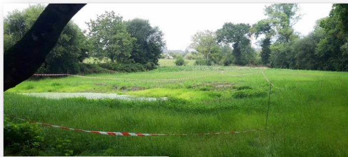
Le plan d'eau

Ce plan d'actions communal s'inscrit dans le cadre de l'Atlas de la biodiversité intercommunale de Dinan agglomération, comportant 4 axes principaux :