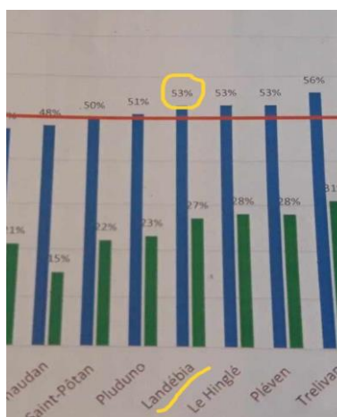
Données d'approvisionnement 2023 publiées par les communes sur la plateforme Ma Cantine au 31/07/2024